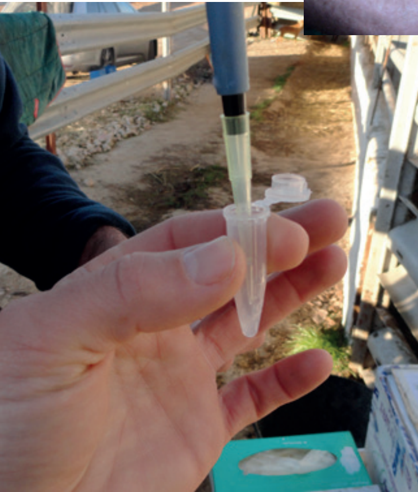
↙ Evaluación del semen