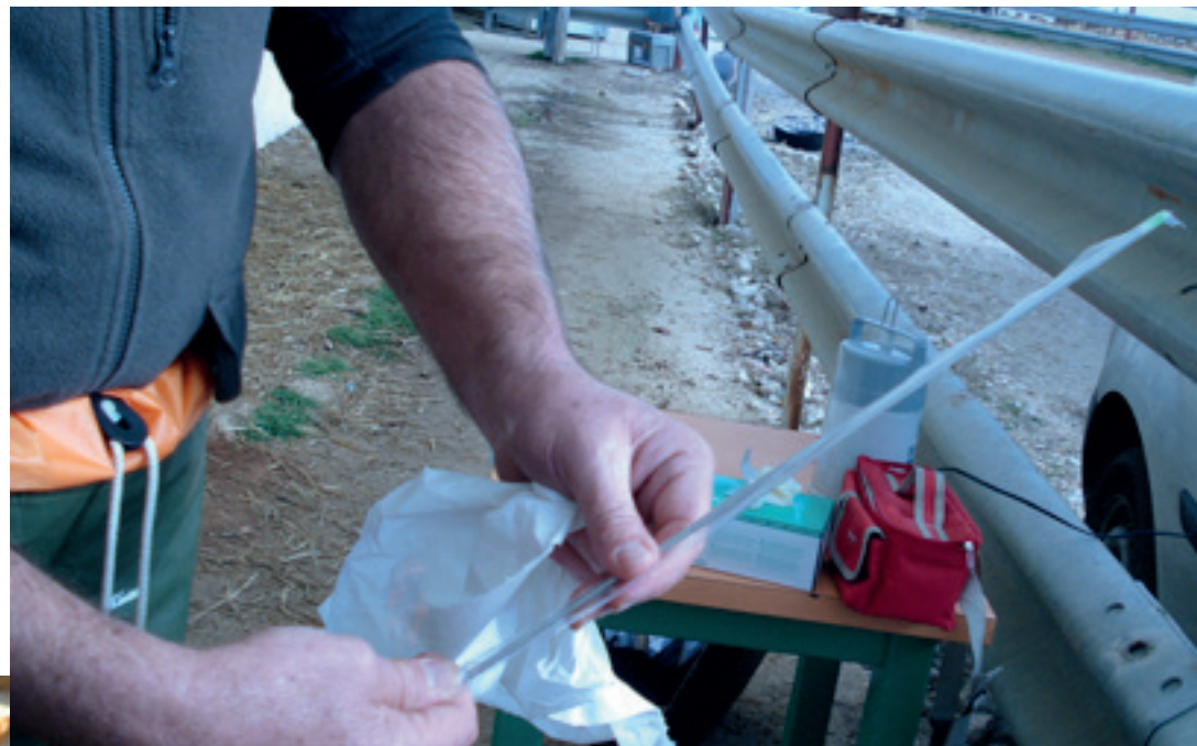
Preparación del catéter ➔