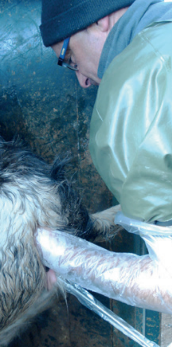
Correcta manera de inseminar ➔