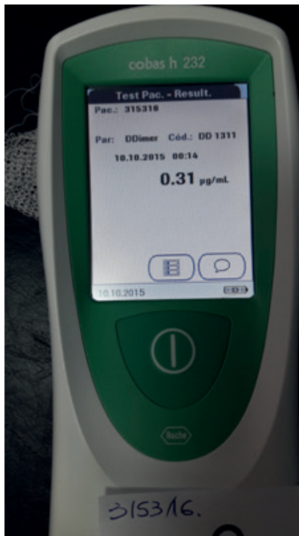
Imagen 5: Analizador para diagnóstico cardiovascular humano, validado para la determinación de dímero-D en perros (Cobas h232, Roche Diagnostics). El valor de referencia está establecido en <0.2 \text{ ug/ml} . El paciente era un perro con dirofilariosis no diagnosticada, que mostraba síntomas compatibles con tromboembolismo pulmonar (disnea, tos y fiebre). El resultado obtenido, junto con la exploración, historial y anamnesis, demostró un elevado indicio de tromboembolismo parasitario, lo que justificó el inicio de terapia específica para su manejo.

Estudios publicados han mostrado la relación de la respuesta inmune inicial con la interacción con el parásito D. immitis , clasificándola como respuesta innata, y que consiste en la respuesta inmune frente a las formas adultas, microfilarias y Wolbachia . Hay estudios que han determinado las concentraciones de las PFA positivas y negativas en perros con dirofilariosis. Las PFA positivas evaluadas fueron la PCR, la haptoglobina y la ferritina, mientras que las PFA negativas evaluadas han sido la albúmina y la paraoxonasa-1 (PON-1). En perros con dirofilariosis se observaron mayores concentraciones de PCR, ferritina, y un descenso significativo de la albúmina y la PON-1 independientemente del estado microfilarémico del animal, mostrando una respuesta de fase aguda, probablemente debido a la existencia de daño tisular a nivel pulmonar y vascular asociado a la presencia de gusanos adultos. Por otro lado, se observaron bajas concentraciones de haptoglobina, especialmente en perros microfilarémicos, generando discrepancias entre el comportamiento de las PFA positivas. Sin embargo, esta discrepancia puede explicarse por la presencia de anemia hemolítica provocada por la infestación: la hemoglobina se libera de los eritrocitos uniéndose a la haptoglobina hasta la saturación de la proteína y es retirada de la circulación.