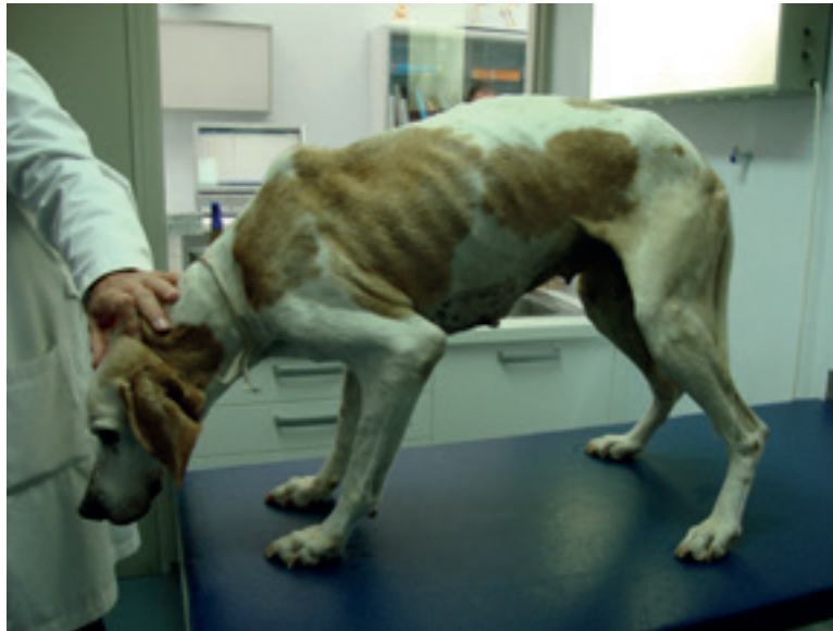
Imagen 8: Perro con dirofilariosis cardiopulmonar. Se presentó en consulta con los signos clínicos más frecuentes (tos, intolerancia al ejercicio y pérdida de peso progresiva). Se trataba de un perro de caza que hacía ejercicio intenso regularmente. Dado que la actividad física en perros infectados es un mal indicador pronóstico, se optó por hacer un estudio completo antes de iniciar tratamiento. El estudio de biomarcadores serológicos nos ayudó a clasificar la gravedad del animal, junto a las técnicas de diagnóstico por imagen.