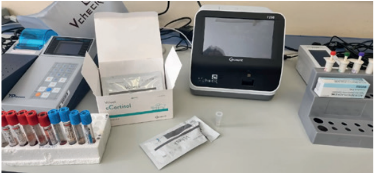
Imagen 6: La medición de biomarcadores serológicos permite obtener un dato clínico de manera sencilla - tras la extracción de una muestra de sangre - y objetiva, al tratarse de un resultado numérico. Esto hace que su aportación a la clínica diaria presente un valor añadido, especialmente en aquellos centros que no tienen disponibilidad inmediata de otros medios diagnósticos (por ejemplo, ecocardiografía). En la imagen, un analizador de cortisol canino (VCHECK V200, Bionote).

pulmonar persistía. Concretamente, se ha visto que las concentraciones de PCR elevadas persisten 1 mes tras finalizar el tratamiento adulticida en los perros que presentan hipertensión pulmonar, mientras que los valores de esta PFA regresa a la normalidad en la mayoría de los pacientes sin hipertensión pulmonar.