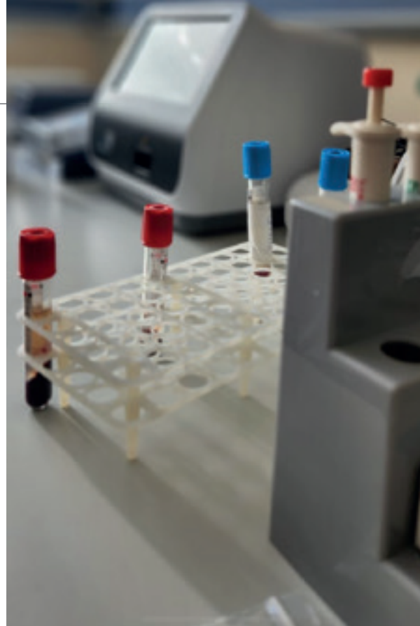
Imagen 1: Suero obtenido para realizar la medición de biomarcadores serológicos en el Laboratorio de Patología General, Facultad de Veterinaria, Universidad de Las Palmas de Gran Canaria.

Los péptidos natriuréticos son hormonas que se sintetizan principalmente en los cardiomiocitos auriculares y ventriculares. Son liberados frente a la sobre-estimulación crónica del sistema