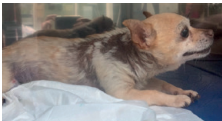
Imagen 2: Paciente con dirofilariosis, carga parasitaria elevada según valoración ecocardiográfica, sufriendo un tromboembolismo pulmonar posterior a 2ª dosis de tratamiento adulticida. Medida de dímero-D: 0.8 mcg/mL (valor de referencia: <0.2 mcg/mL). Hospitalizado en el Hospital Clínico Veterinario de la Universidad de Las Palmas de Gran Canaria (ULPGC).

Sin embargo, y al igual que sucede en medicina humana, aunque podemos utilizar este biomarcador para la detección de TEP, el dímero-D constituye un marcador específico de la actividad fibrinolítica en procesos que producen una excesiva formación de fibrina, aun sin ser de naturaleza trombótica. En veterinaria, otras patologías como una sepsis, insuficiencia cardíaca congestiva, fallo hepático, fallo renal agudo,