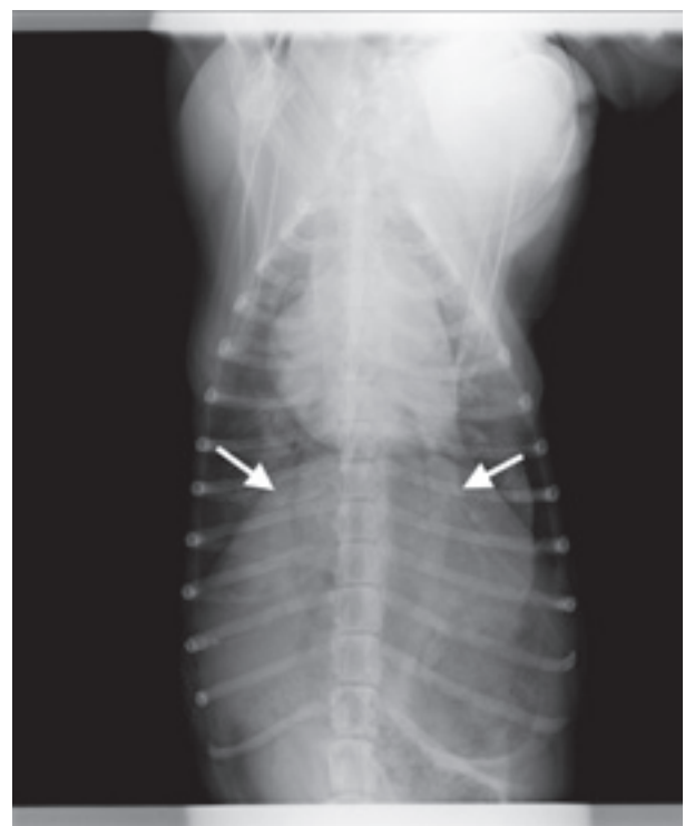
Imagen 3 y 4: Radiografías laterolateral y dorsoventral de un paciente con tromboembolismo pulmonar secundario a dirofilariosis en el Hospital Clínico Veterinario de la ULPGC. Se observa un patrón mixto alveolo-intersticial, con un aumento de opacidad de lóbulos pulmonares así como un marcado patrón vascular, con un aumento del calibre de las arterias pulmonares que además, presenta un recorrido tortuoso.