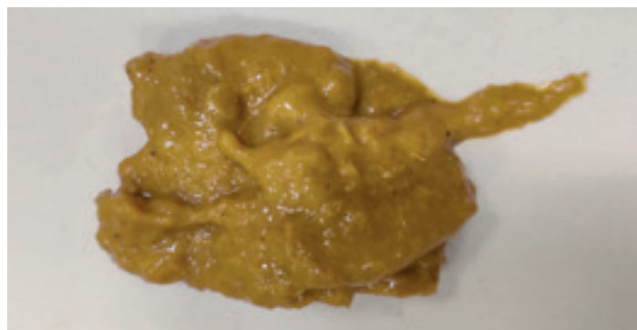
Foto 1. Diarrea de intestino delgado en un perro con enteropatía que responde a inmunosupresores.

Al comparar cada uno de los parámetros incluidos en el índice de actividad CIBDAI antes y después del tratamiento, también hubo una disminución de la gravedad media de todos ellos, salvo de la frecuencia de vómitos ya que ninguno de los casos de este estudio presentó vómitos ni antes ni después del tratamiento. No se encontraron diferencias estadísticamente significativas en ellos, si bien la frecuencia de la defecación y el peso mejoraron con resultados próximos a la significación estadística ( p=0,0625 en ambos casos).